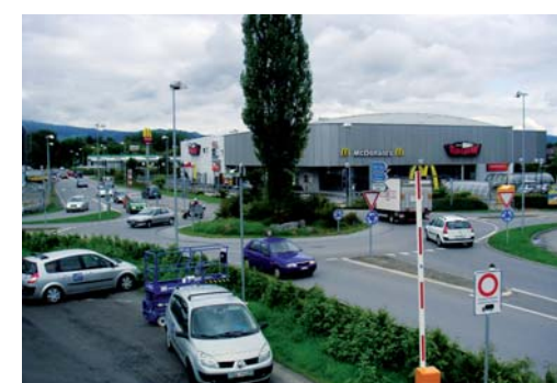
Die Gurnigelstrasse wird durch die Gebietserschliessung Heimberg Süd entlastet