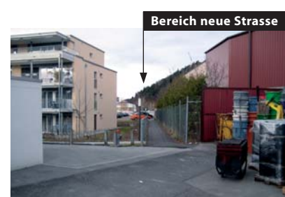
Bereich neue Strasse Bild 2 Direkt anschliessend an die Halle wird die neue Strasse erstellt. Das Wohnhaus ist z. B. mit einer Schallschutzmauer vor Strassenlärm zu schützen.