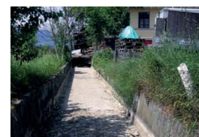
Der Mülibach heute

Für den Kanton Bern und die Gemeinde Steffisburg ist klar: Was die Glättimüli und das Glockental an Quadratmetern verlieren, sollen sie an Qualität gewinnen: