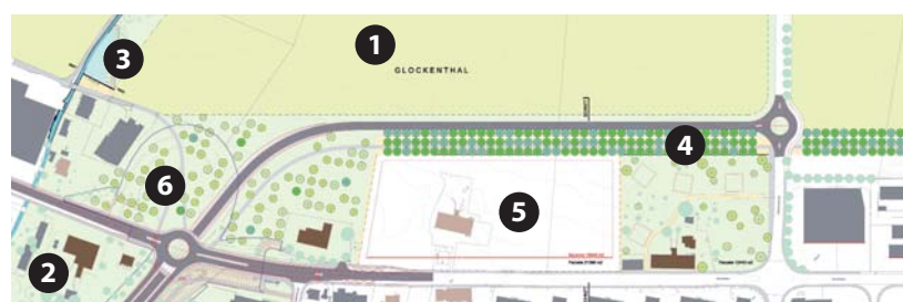
Planausschnitt Verlängerung Stockhornstrasse

8 Um den Grünraum beim Kreisell Glättimüli zu erhalten wird vermutlich Bauland nördlich des Kreisells gegen Land beim Gewerbegebiet abgetauscht