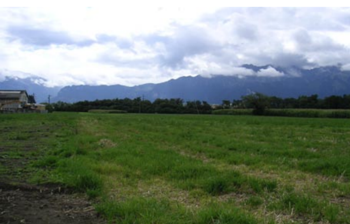
Obere Au Richtung Autobahnzubringer

Die Verbindungsstrasse zum Bypass Thun Nord ist grundsätzlich eine Gemeindestrasse, welche durch die Gemeinde Heimberg beschlossen und finanziert wird. Als Teil des Agglomerationsprogrammes wird der Ast Heimberg voraussichtlich von Bundessubventionen und Kantonsgeldern profitieren. Die Grundlagen für das Projekt werden im Studienauftrag zum Bypass Thun Nord erarbeitet. Der Knoten „Anschluss Heimberg Süd“ auf dem Autobahnzubringer ist Teil des Bypass Thun Nord, wird aber nur gebaut, wenn Heimberg ja zum Ast Heimberg Süd sagt.